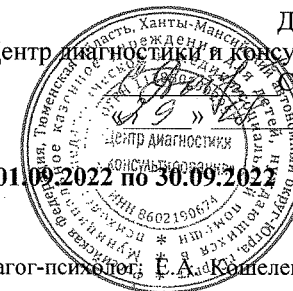
График заседаний территориальной психолого-медико-педагогической комиссии 3 (ТПМПК 3) на период с 01.09.2022 по 30.09.2022