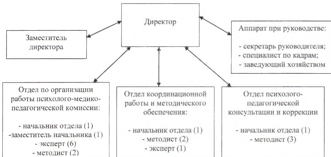
Структура МКУ «Центр диагностики и консультирования» в 2016 году

Разработаны положения об отделах, должностные инструкции каждого работника, количественные показатели деятельности отделов.